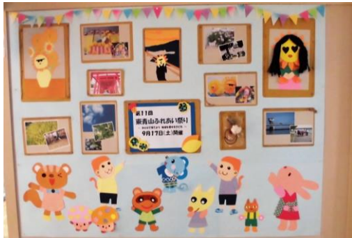
ラフイー仮面が世界の名画にへんしん!