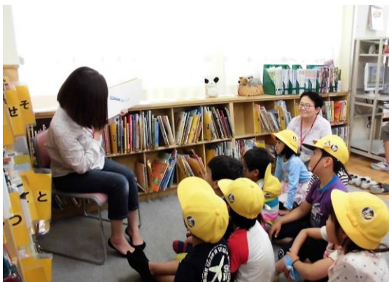
昼休みのお話し会の様子