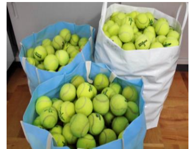
皆さんからいただいたボールは、500個を超えました。