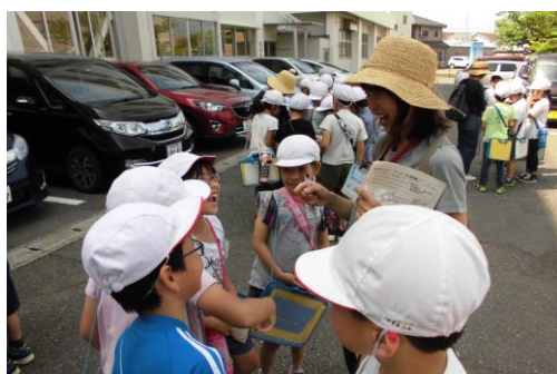
小針青山公民館や、小針球場を訪問

子どもたちとの顔合わせからスタートします。 目的地はどこかな? どの道を通っていくのかな?