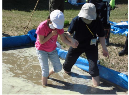
平らに均した後、田植えを行います

最初こそ怖々としていた子どもたちでしたが、一歩ずつ進んでいくうち楽しくなっている様子です。“ 足が抜けない！ ”と慌てる子も見られましたが、だんだんと上手く進めるようになりました。