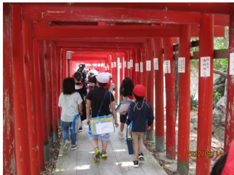
青山稲荷神社にも立ち寄りました。赤い鳥居の数を数える子どもたちです。